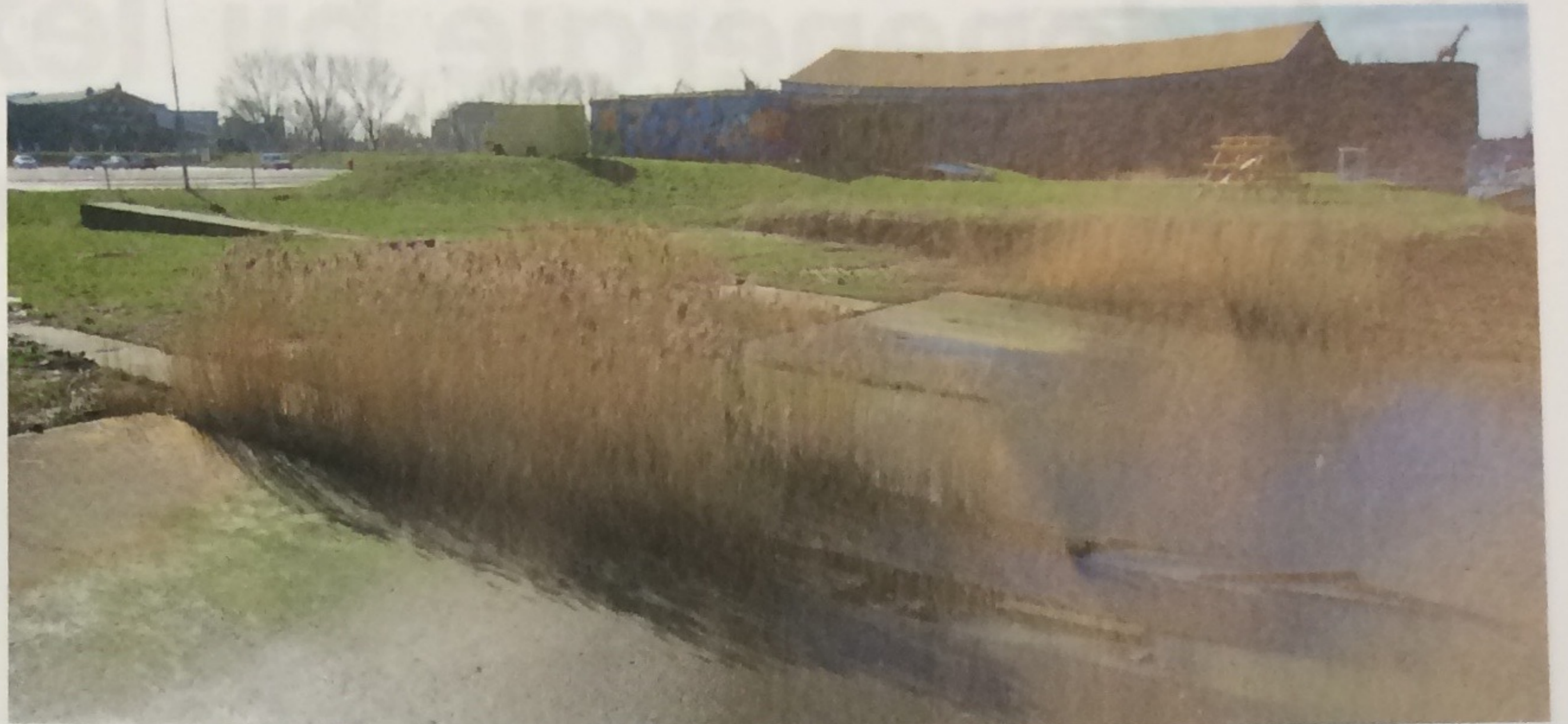
De oever bij Stadswerven loopt geleidelijk af. Betonplaten voorkomen natuurlijke vorming van begroeiing.

Bij het Mallegatpark is het hoogteverschil tussen het land en het water vrij groot. Het inrichten van de landzone voor een getijdenoever is hierdoor niet haalbaar, maar ook niet wenselijk vanwege het ruimtebeslag hiervan in