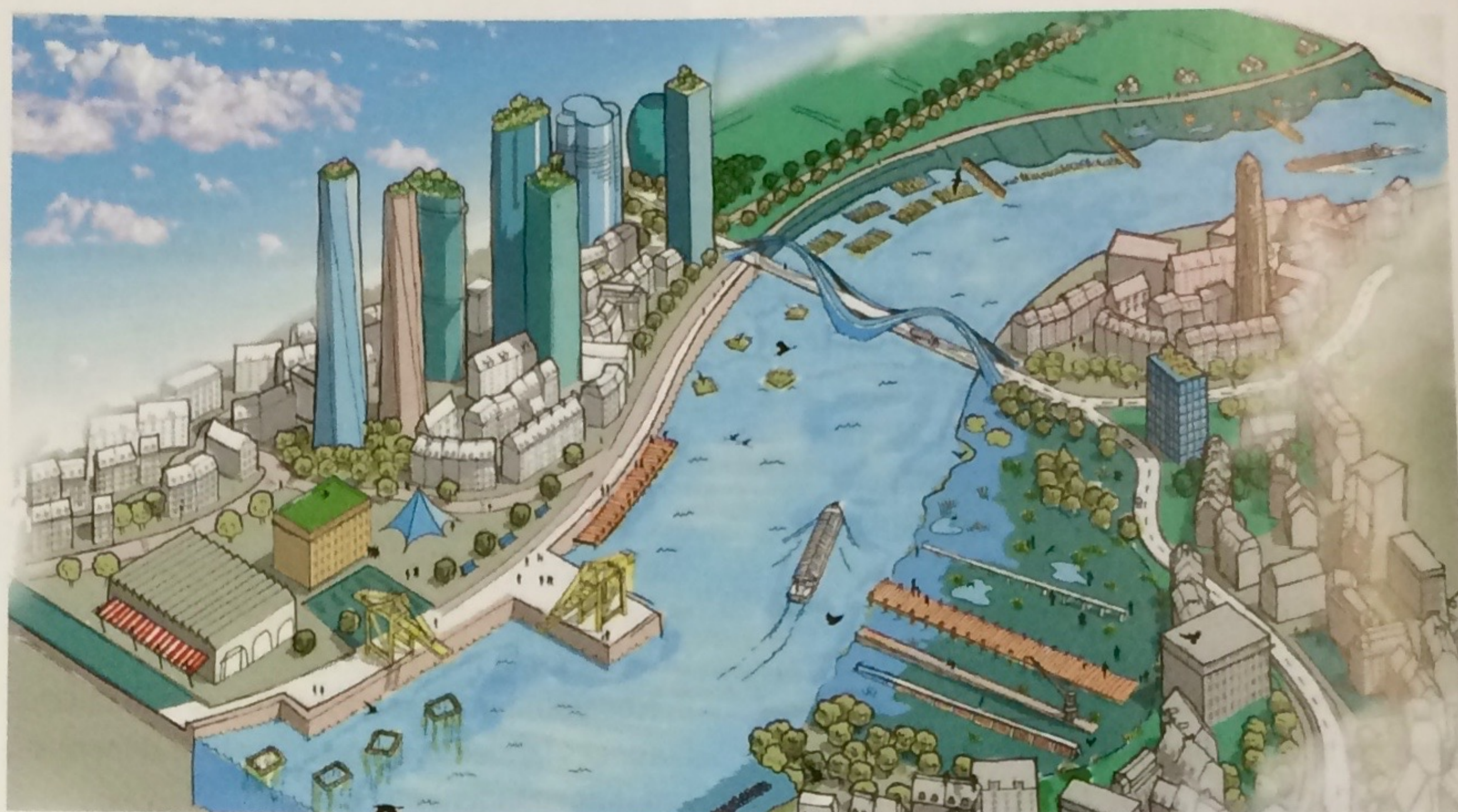
Een artist impression verbeeldt hoe de getijdennatuur in stedelijke omgeving eruitziet (Tekening Frederik Ruys, copyright Ecoshape, Deltares en Witteveen+Bos)

Building with Nature gaat een stap verder dan vergroening