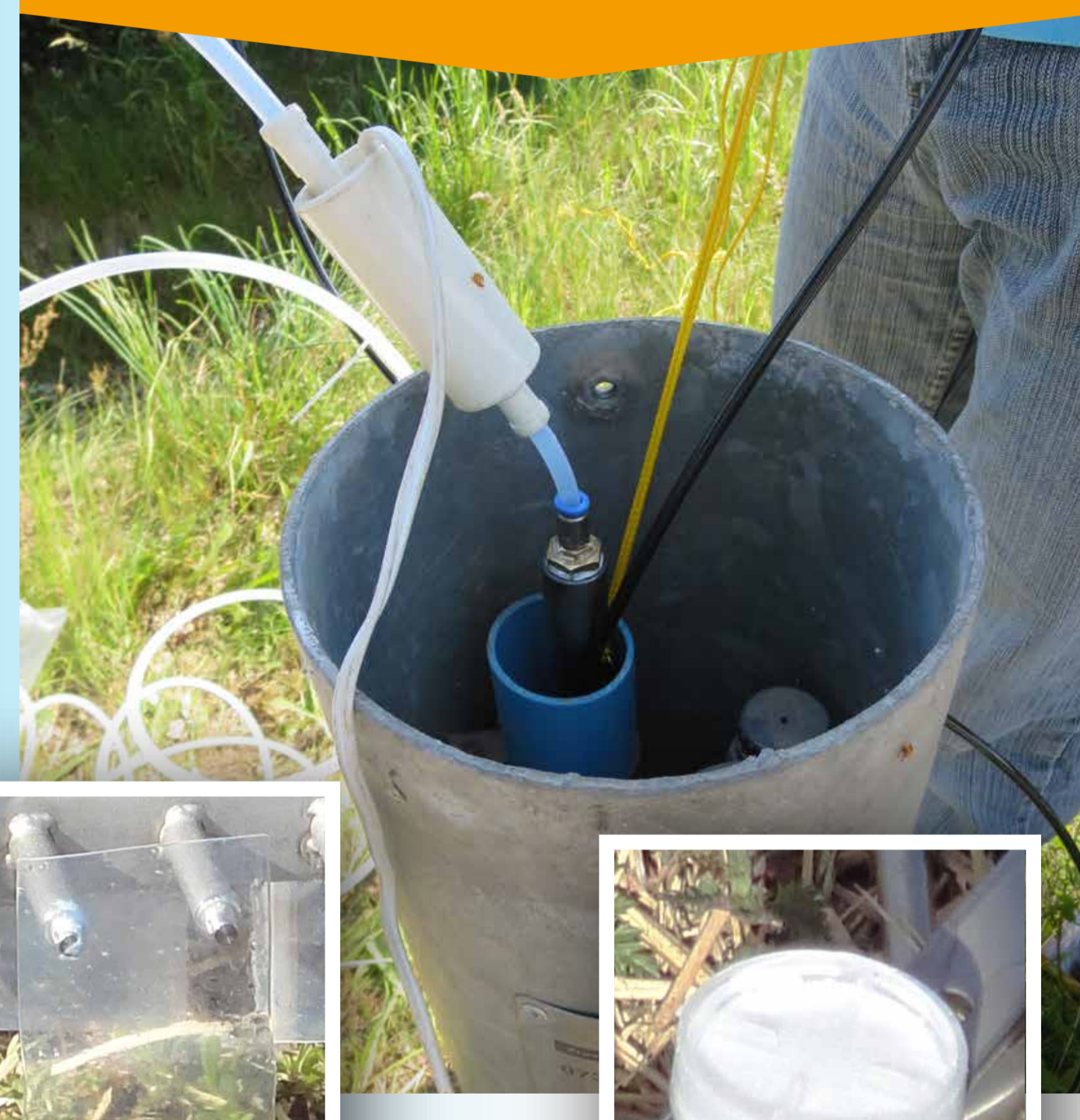
In peilbuis voor grondwaterbemonstering

Spoort over langere tijd effectief concentraties verontreinigingen op